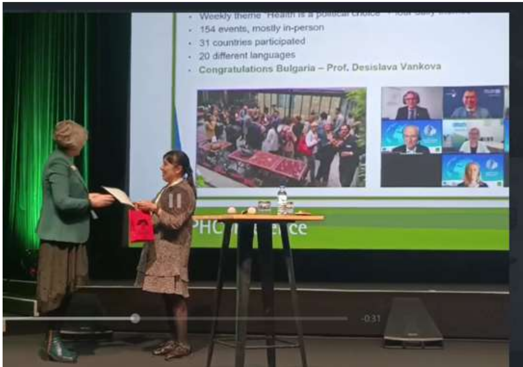
Връчване на наградата на ЕУРНА за приноса на БАОЗ към ЕУРНВ 2024